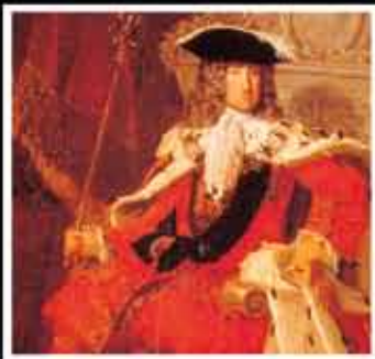
Frédéric Ier, huile sur toile anonyme, début du 18 e siècle.