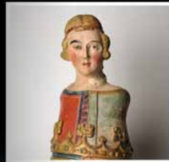
Casque avec cimier, sculpture en pierre polychromée, milieu du 14 e siècle.