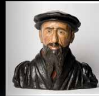
Buste de Farel, terre cuite peinte, 16e siècle.

Winzerfest; 24., 25. und 31. Dezember und 1. Januar.