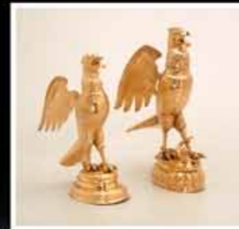
Hanaps «Aigle», Nicolas Wittnauer, Neuchâtel, argent doré, deuxième moitié du 17 e siècle.