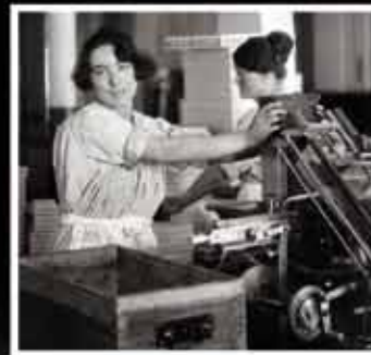
Ouvrière de l'atelier de pliage des tablettes Suchard à Serrières, photographie d'Ernest Sauser, 1926.