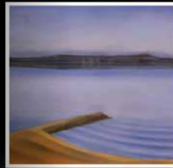
Lac de Neuchâtel n°III, huile sur toile de Pierre-Eugène Bouvier, 1927.