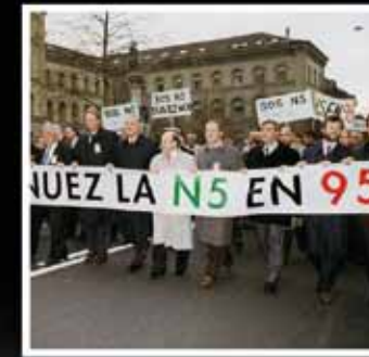
Politiciens neuchâtois revendiquant à Berne l'achèvement de la N5, photographie de Christian Galley, 25 novembre 1994.