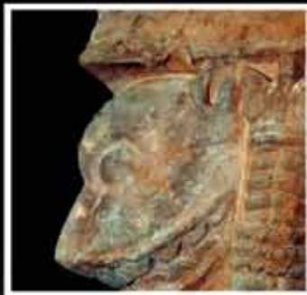
Corbeille de chapiteau décorée de quatre têtes de lions provenant du château de Neuchâtel, 12 e siècle. Laténium.