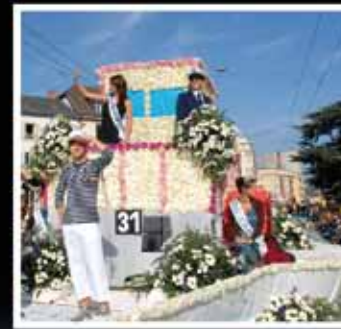
Fête des vendanges, photographie de Stefano Iori, 2007.