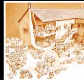
Vue restituée de la résidence seigneuriale des Neuchâtel vers 1200, dessin de Wilfried Trillen, 2010.