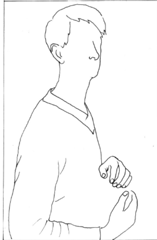
« François à la tête de mort »