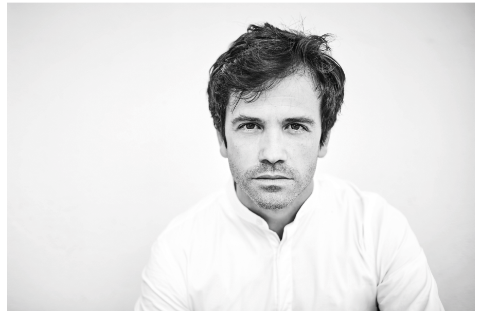
Portrait d'Ignacio Prego.

M. Prego a mené une carrière de concertiste intense des deux côtés de l'Atlantique, se produisant dans les plus grandes villes d'Amérique du Nord, d'Asie, ainsi que dans la grande majorité des pays d'Europe et d'Amérique du Sud. Il a fait ses débuts en récital de clavecin solo en 2023 au Festival Oude Muziek d'Utrecht, aux Pays-Bas. Parmi les autres salles où il s'est produit figurent l'Alice Tully Hall du Lincoln Center, le Metropolitan Museum et la Frick Collection à New York, la National Gallery à Washington DC, le Benaroya Hall à Seattle, le National Center for the Performing Arts à Pékin, l'Esplanade à Singapour, le Palacio Euskalduna à Bilbao, ainsi que le Teatro del Canal et l'Auditorio Nacional à Madrid. Il participe également à des festivals de musique ancienne tels que ceux de Berkeley, Boston, Séville (FeMAS), Vancouver, Chiquitos, le Festival international de Santander, le FIAS, entre autres.