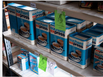
5. Récolement des emballages de la collection Suchard-Tobler