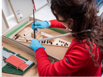
1. Opération de dépoussiérage d'une maquette ancienne