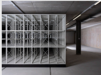
4. Rayonnage mobile pour la conservation des collections à Tivoli Nord