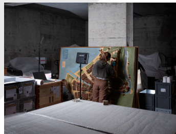
6. Préparation au transport d'une maquette ancienne