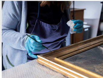
2. Nettoyage d'un tableau de la collection ©MahN - Photo: Maciej Czepiel