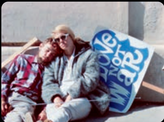
VOYAGE CHEZ LES VIVANTS

MA 23.11 15H SA 04.12 18H30 JE 23.12 21H