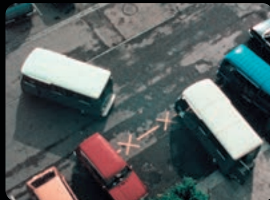
JAMAIS JE NE T'OUBLIERAI, LE BÂTON ET LA CAROTTE