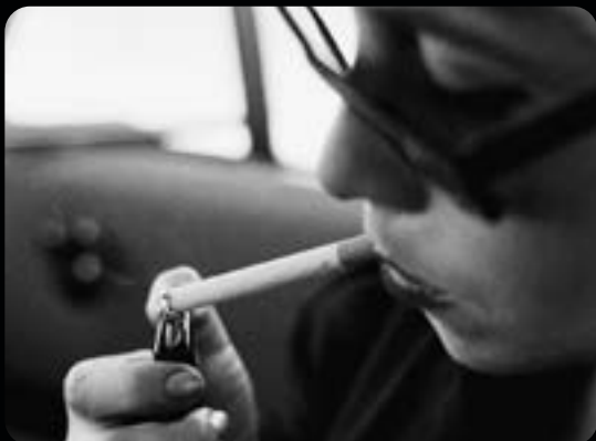
LA CHANCE DES AUTRES, POURQUOI PAS VOUS?, LA SUISSE S'INTERROGE

MA 23.11 18H30 VE 03.12 18H30 DI 26.12 18H30