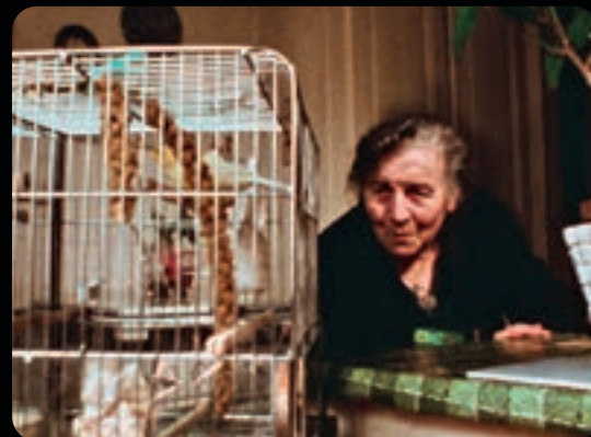
LE DERNIER PRINTEMPS