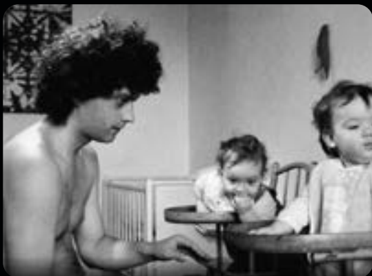
LA MAISON OUVERTE, LE BLÉ DES PHARAONS