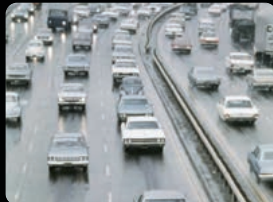
CHRONIQUE DE LA PLANÈTE BLEUE