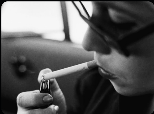
LA CHANCE DES AUTRES, POURQUOI PAS VOUS?, LA SUISSE S'INTERROGE

MA 23.11 18H30 VE 03.12 18H30 DI 26.12 18H30