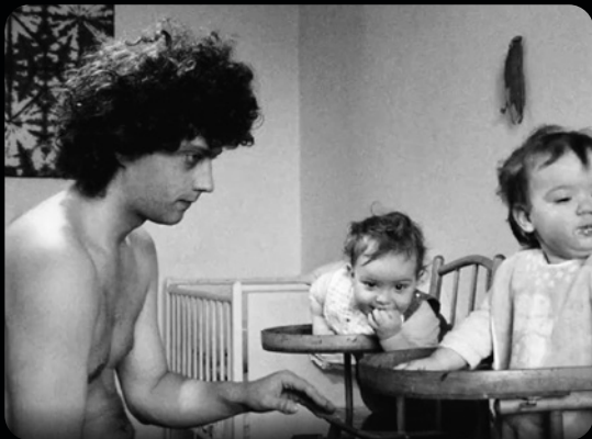
LA MAISON OUVERTE, LE BLÉ DES PHARAONS