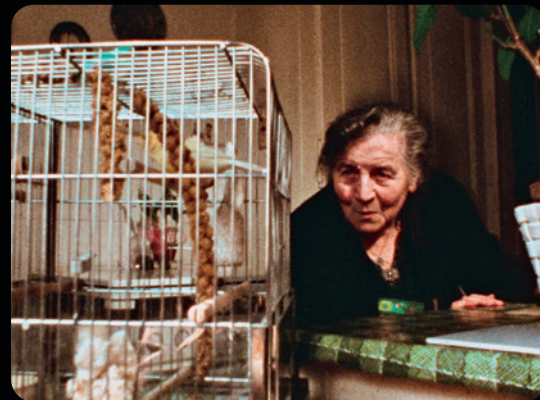
LE DERNIER PRINTEMPS