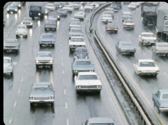
CHRONIQUE DE LA PLANÈTE BLEUE