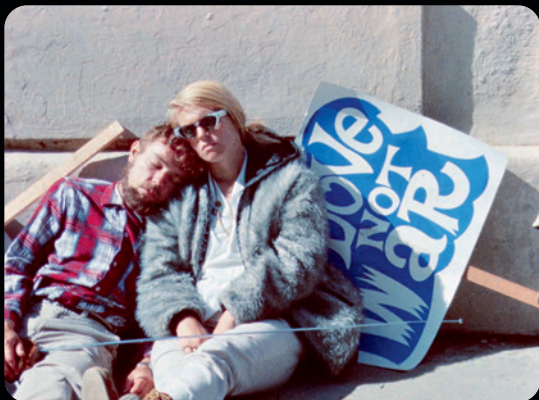
VOYAGE CHEZ LES VIVANTS

MA 23.11 15H SA 04.12 18H30 JE 23.12 21H