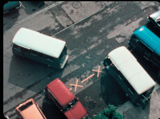
JAMAIS JE NE T'OUBLIERAI, LE BÂTON ET LA CAROTTE