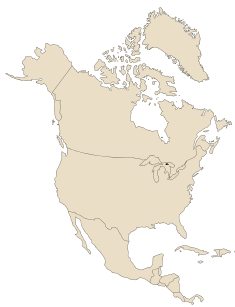
Amérique du Nord et centrale