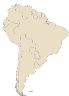
Amérique du Sud